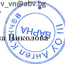
График за провеждане на дейностите в електронна среда в III ОУ „Ангел Кънчев“ – гр. Варна